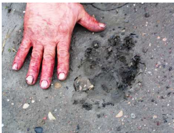
Bjørnespor i sanden.

bruke tid på det her? Det er dog en liten viktig ting jeg har lært av egen erfaring, og det er at det har betydning hvilken kombinasjon belte/ knivslire du bruker. Og det jeg vil påpeke som viktig, er at hvis du har lærbelte og også knivslire av lær, så har det lett for å oppstå knirke-lyder mellom belte og slire når du beveger deg. Dette gjelder særlig hvis du bruker foldekniv i hylster som du trer innpå beltet. Jeg bruker tilfeldigvis sistnevnte type, og jeg har ved flere anledninger når jeg krumbøyd prøver å snike meg frem mot vilt, hørt knirking mellom belte og slire. Når jeg greier å høre det, så hører i hvert fall viltet det med sin superskarpe hørsel. Derfor, bruk kombinasjon av lærbelte/nylon slire, eller omvendt, nylon belte/lærslire. En liten detalj kanskje, men viktig. Vi må lære oss å ferdes absolutt lydløst i skogen.