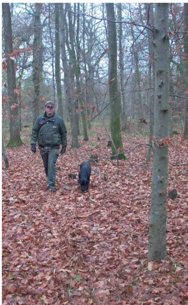
En hund er alltid et godt hjelpemiddel under sporing av skadde dyr.