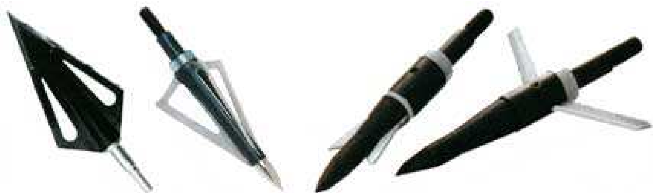
Ulike typer jaktspisser; faste blader, utskiftbare blader og mekaniske spisser der bladene folder seg ut etter treff.

til hjerte og lunger. Skytteren må derfor alltid tilstrebe å ikke skyte før dyret fører beinet på innslagssiden forover, og dermed "blottlegger" de vitale organene. Dette kan ofte være en vanskelig vurdering i skuddøyeblikket, men absolutt nødvendig for å unngå skadeskyting.