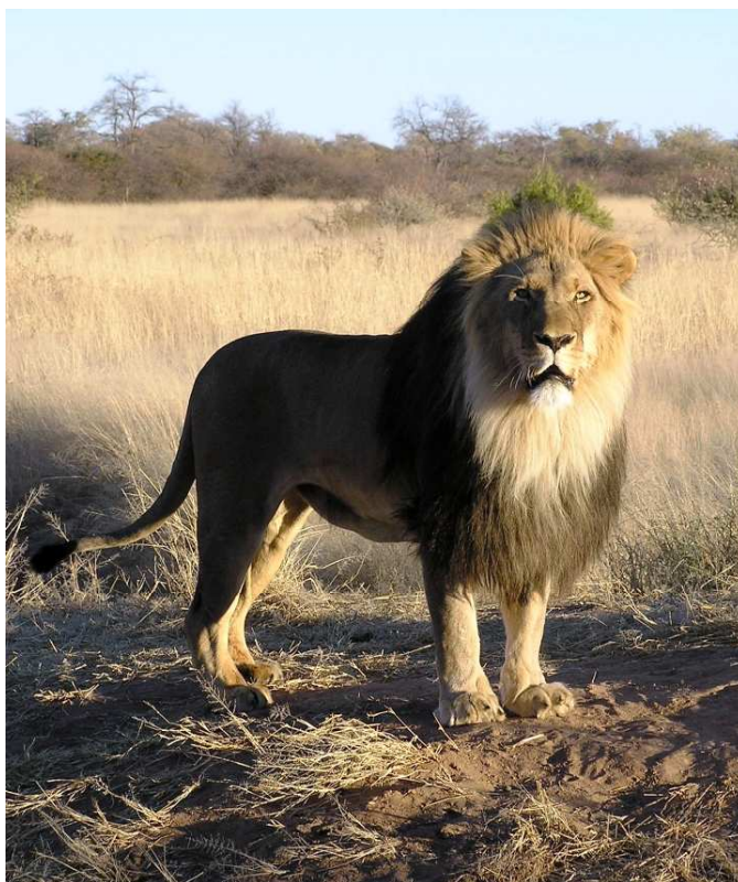
Kamerjakt er også jakt. Bildet av denne Kongen er tatt i Namibia.

Ta ikke bilde med pil(er) stikkende ut av dyret. Det kan virke støtende på enkelte. Fjern alle piler før